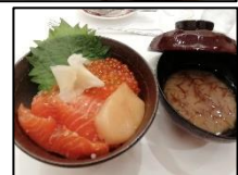
夕食のコース料理(一部)→